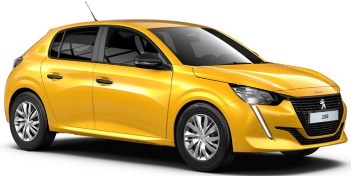
immagini riferite alla versione termica